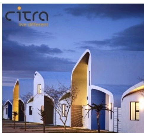
eHomes by Citra Platinum Winner